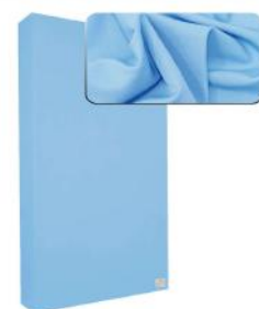
11. Light Blue