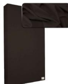
20. Dark Brown