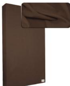
19. Light Brown