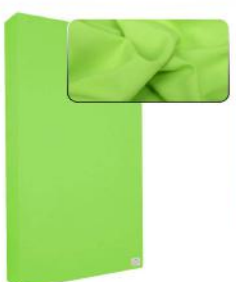
7. Light Green