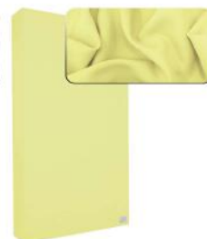
5. Light Yellow