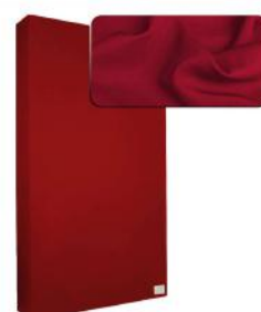
16. Deep Red