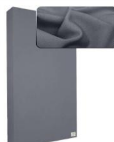
23. Dark Grey