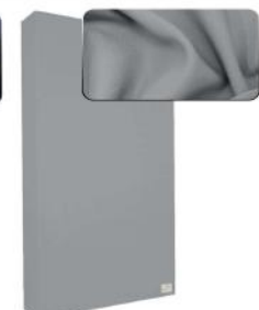
22. Light Grey