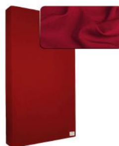
16. Deep Red