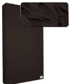
20. Dark Brown