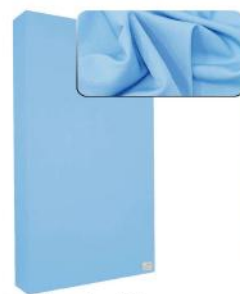
11. Light Blue