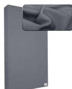
23. Dark Grey