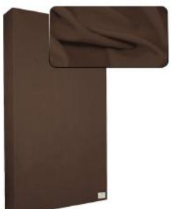
19. Light Brown