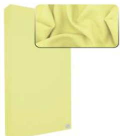
5. Light Yellow