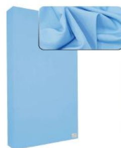
11. Light Blue