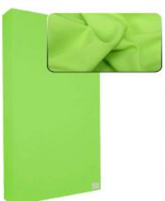
7. Light Green