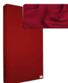
16. Deep Red