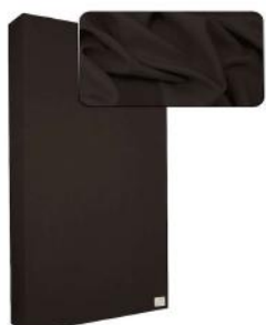
20. Dark Brown