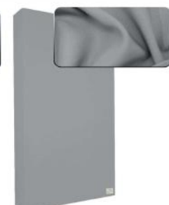
22. Light Grey