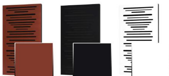
7. Red 8. Black 9. White