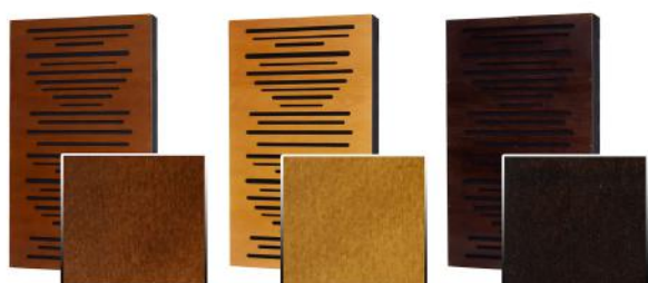
4. Brown 5. Light Brown 6. Wenge