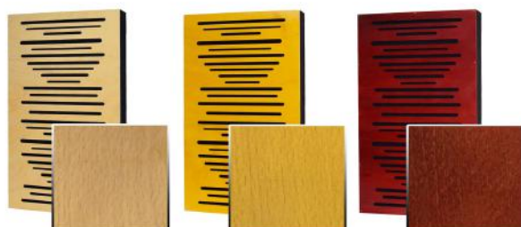
1. Natural 2. Curcumma 3. Mahogany